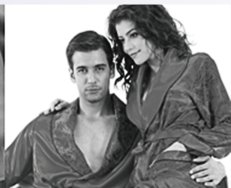
Домашний текстиль и одежда для дома