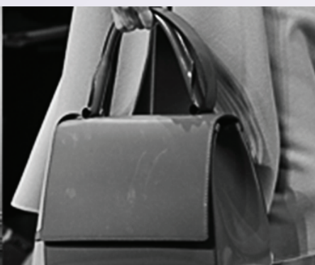
Сумки и аксессуары