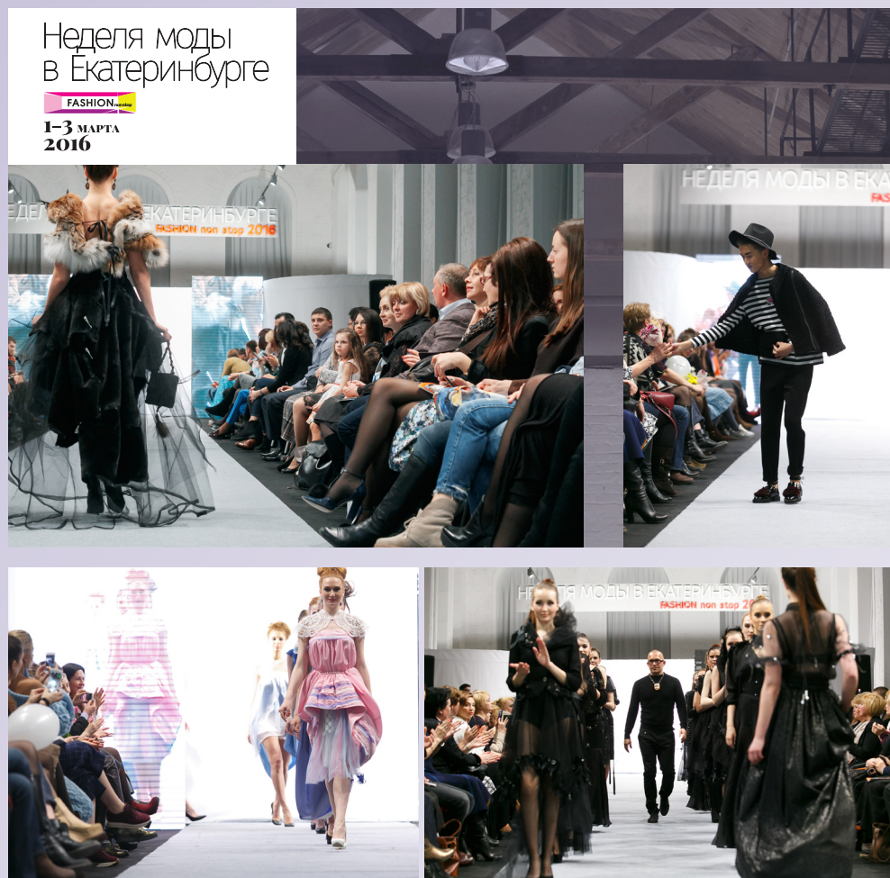
Фото выставки Fashion Trade Show, г. Екатеринбург, 1-3 марта 2016

Неделя моды предлагает вниманию профессиональной аудитории байерские и дизайнерские показы моды.