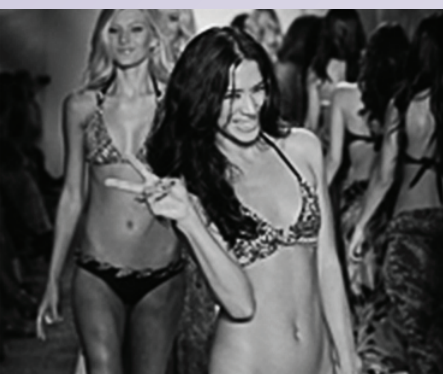
Нижнее белье & купальники