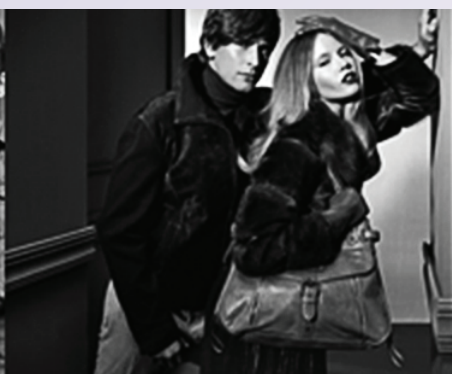
Изделия из кожи & меха