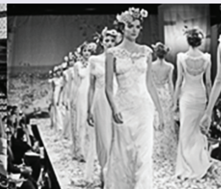
Свадебные и вечерние наряды