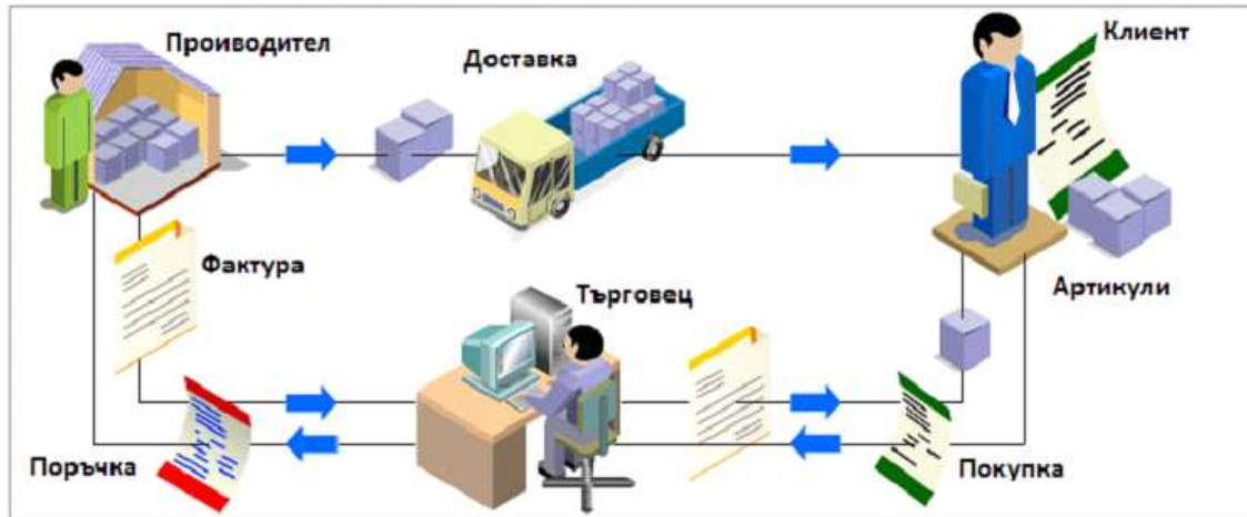
Фиг.1 Стандартна Търговия