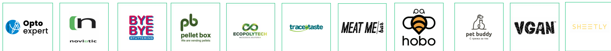
Optoexpert Noviotic Bye Bye Stuttering Pellet Box Ecopolytech TraceTheTaste MeatMe Hobo Pet Buddy Vgan Sheetly