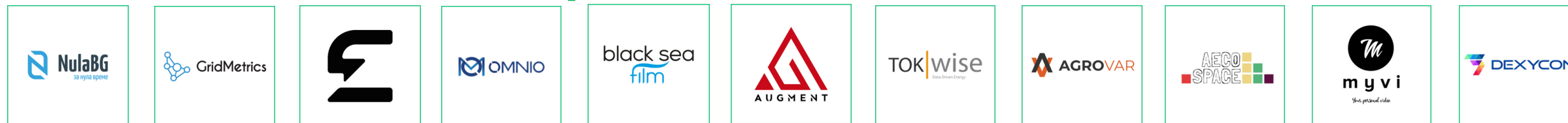
NulaBg GridMetrics Econic One Omnio Black Sea Film Augment TokWise Agrovar AECO Space myvi Dexycon