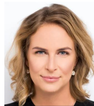
MARIS PRI TALIN, ESTONIA