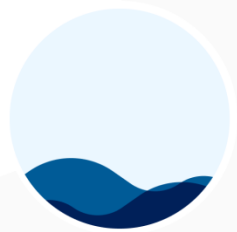
Цел на инструмента