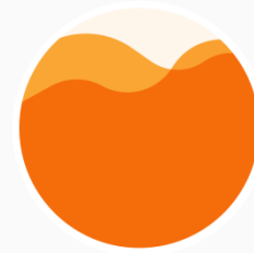
Експертиза на частен сектор