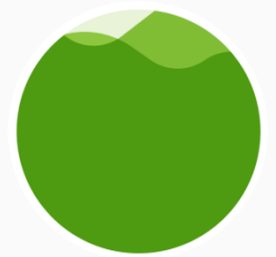
Успешен финансов инструмент